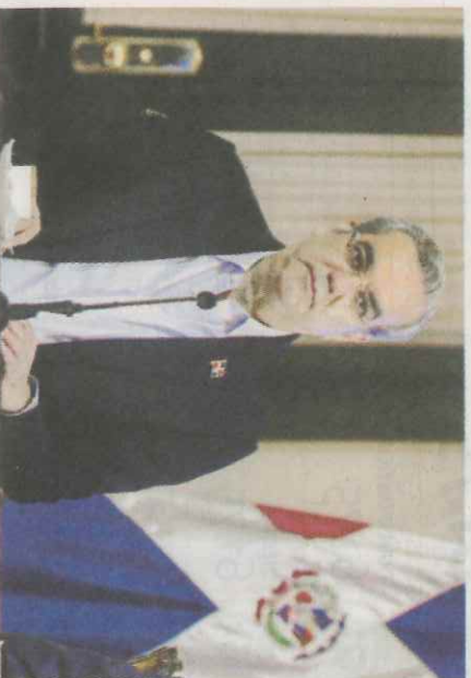
El presidente Luis Abinader.

Diplomática reveló que el mandatario se entrevistará con las máximas autoridades de la Presidencia de la Comisión Europea.